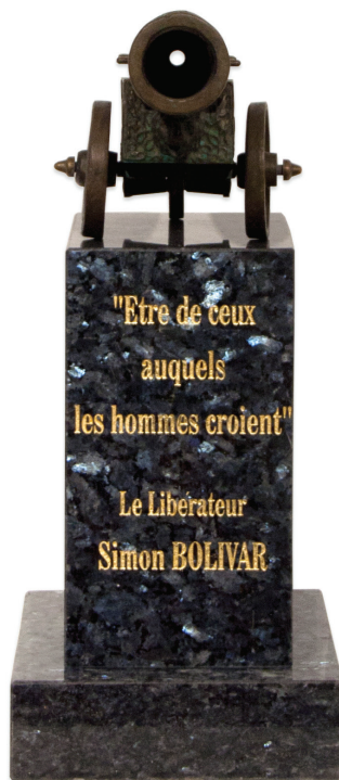
Être de ceux auxquels les hommes croient, 2011 Marbre, étain, feuilles d'or - 17 x 15 x 30 cm

La Galerie Dix9 a le plaisir de vous présenter