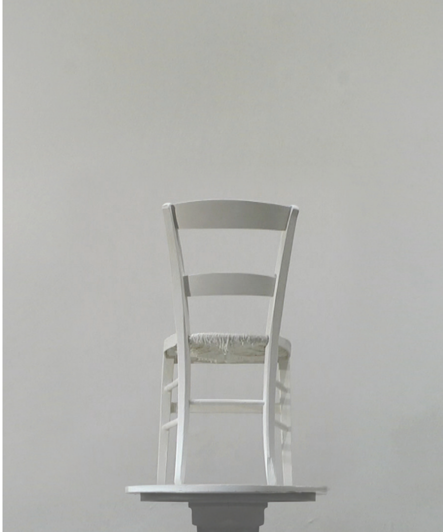
Chair, installation vidéo, 2013, couleur-son