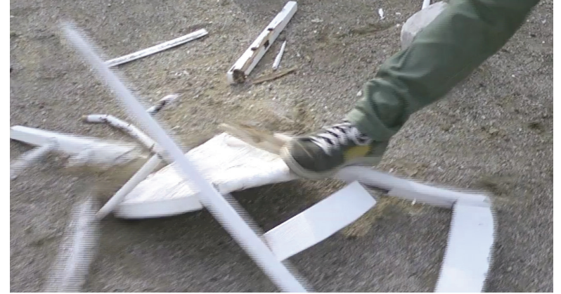
Chair, installation vidéo, 2013, couleur-son